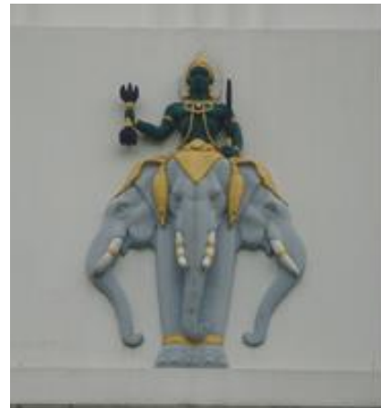
พระพลบดี ตราประจำกรมพลศึกษา