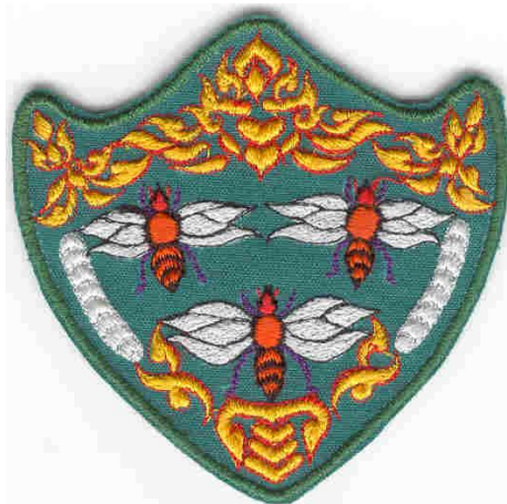
ตราประจำโรงเรียนพลศึกษากลาง (ตราผึ้ง 3 ตัว)

เรื่องราวต่างๆ เหล่านี้คือเรื่องจริงที่กระผมมีอาจะหาเอกสารอ้างอิงได้ แต่เป็นคำบอกเล่าของท่านอาจารย์ทางพลศึกษาในอดีตทั้งสิ้น บทความนี้อาจจะเป็นต้นตอของการค้นคว้าถึงประวัติทางพลศึกษาของเราให้ละเอียดลงไปอีกก็ได้ ถ้าบทความนี้เป็นสิ่งที่ดีงาม กระผมก็ขอกราบขอบคุณครูทุกท่านโดยเฉพาะอย่างยิ่งท่านอาจารย์บุญเจือ สุวรรณพุกษ์ ท่านอาจารย์ภาพ รอดเรืองเดช และท่านอาจารย์นายศรี รตานนท์ ที่ได้ช่วยให้ความกระจ่างในเรื่องนี้มาโดยตลอด